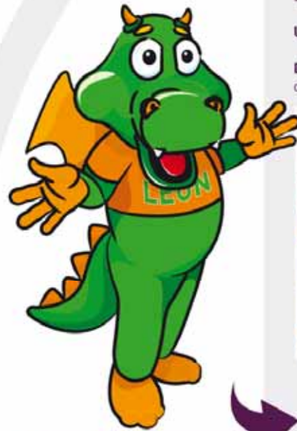
Léon le dragon